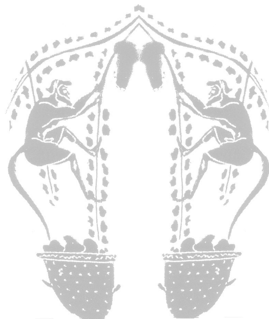
Due piccoli satiri che vendemmiano

Jassarte è un vino artigianale che nasce da un uvaggio di campo molto complesso, la nostra interpretazione moderna della produzione di epoca pre-fillosserica. Allora ogni vigna sapeva raccontare una storia unica, grazie alle particolari sinergie nate dall'accostamento di uve diverse in campo ed in cantina. Tutto questo si è perso nel tempo, in una produzione vinicola ormai omologata a pochi elementi. Come allora, la vigna Campo Giardino esprime una sinfonia potente, una voce unica di straordinaria complessità.