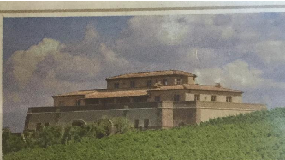
Una veduta del complesso architettonico della tenuta Argentiera.

La Toscana è la regione italiana in cui, sin dalla prima metà degli anni '90, si è maggiormente concentrata la realizzazione di cantine griffate da grandi architetti italiani e stranieri: edifici di alta qualità architettonica, cui sono associate tecnologie innovative di costruzione e produzione, nonché un rinnovato rapporto estetico fra spazio di produzione e prodotto lavorato.