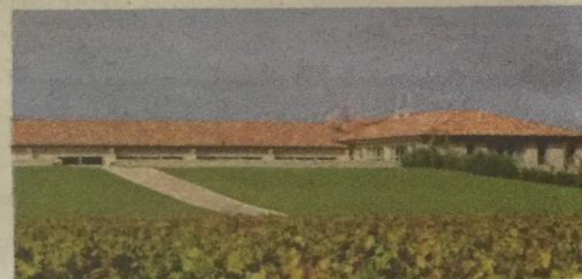
La cantina dell'azienda Donna Olimpia 1898

A selezionarle e a metterle in rete è stata Ci.Vin, la società